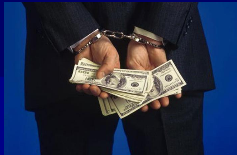
1. Компании, пострадавшие от экономических преступлений